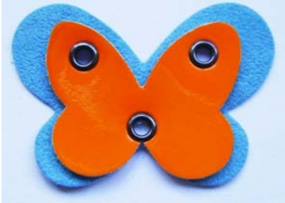
Farfalla Mod. 6