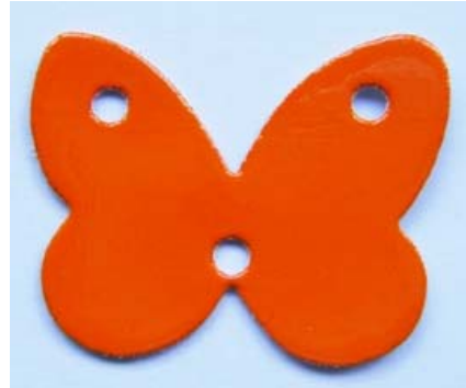
Farfalla Mod. 5