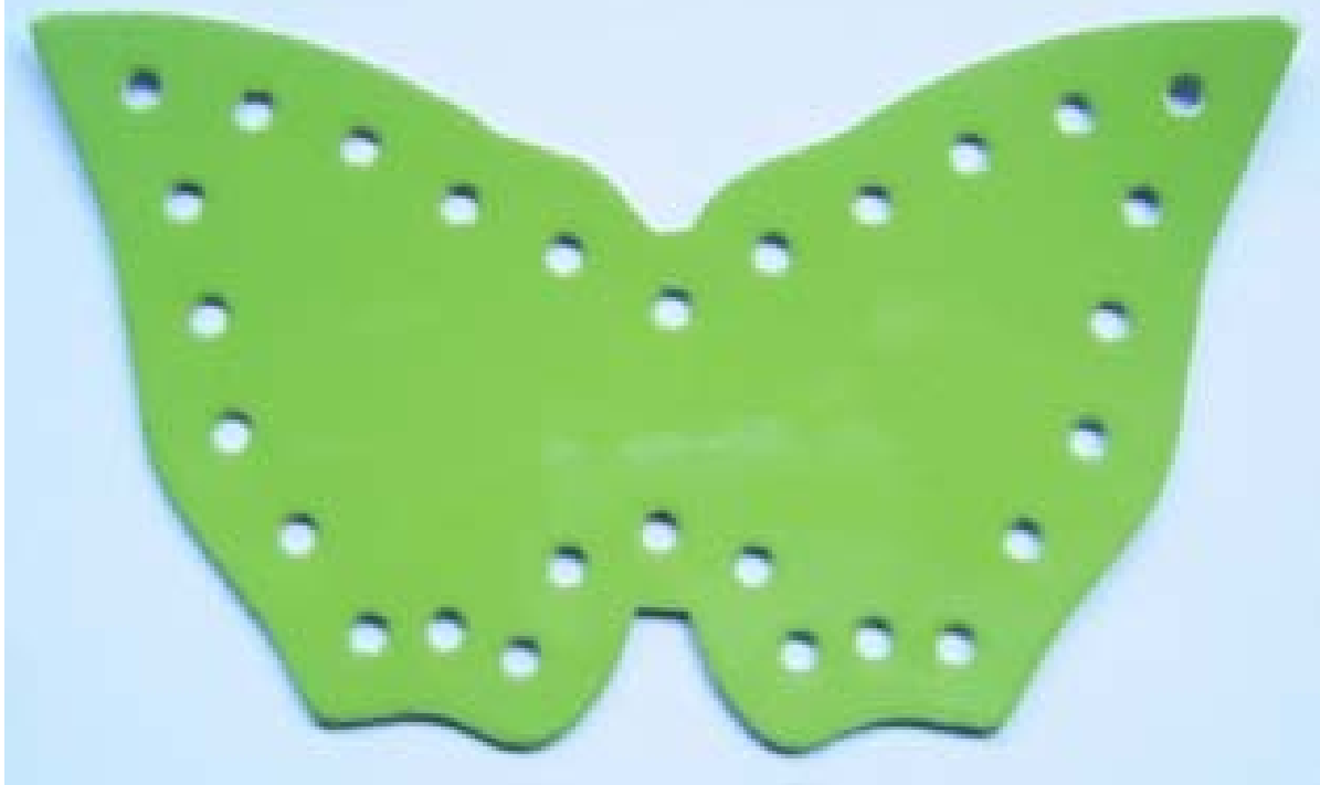
Farfalla Mod. 2