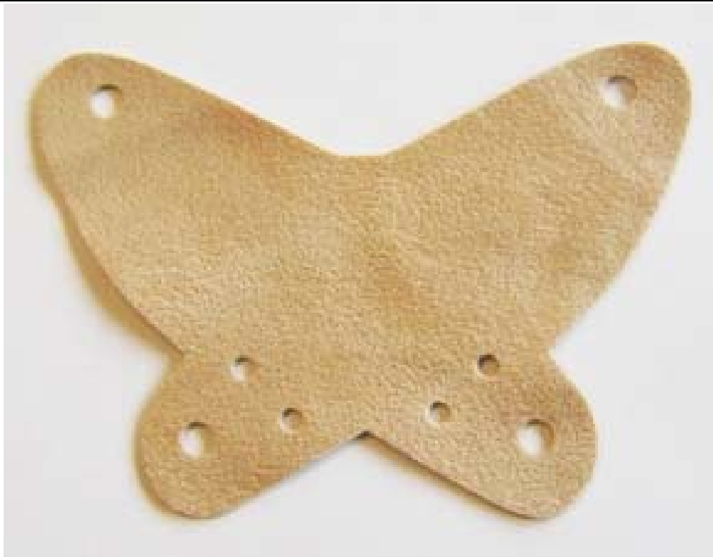
Farfalla Mod. 3